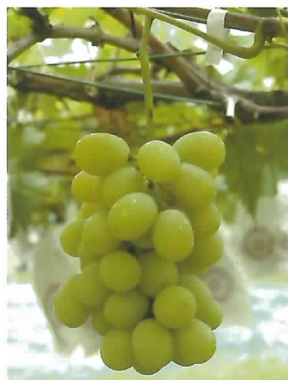
種なし栽培のシャインマスカット