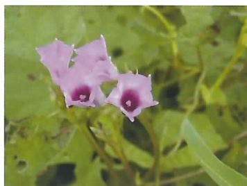
ホシアサガオの花

近年、愛知県のダイズほ場で帰化アサガオ類が発生し、防除が難しいため大問題となっています。従来から4種の帰化アサガオ類の発生が確認されてきましたが、2004~2008年に行った定点調査で「ホシアサガオ( Ipomoea triloba L.)」の発生地点数が増加していることを確認しました。この調査から「ホシアサガオ」が優占種となる可能性が明らかとなったため、本種の生態を重点的に解明し、除草技術の開発を進めます。(作物研究部)