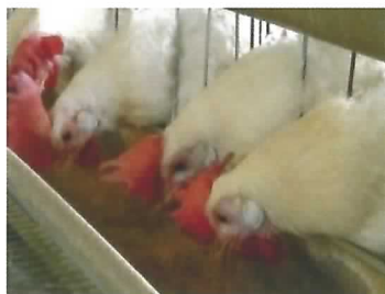
飽食しても休産している鶏

加齢により低下する産卵量と卵の品質を回復するため、これまで、低エネルギーの餌(ふすま)を与えて休産させる方法が用いられてきました。しかし、この方法では給餌量を制限する必要があるため、鶏に満腹感を与えることができずストレスとなっていました。そこで、ふすまにあわ殻を混ぜ、餌をさらに低エネルギーに改良することにより、鶏に飽食させ満腹感を与えながら休産させることが可能となりました。(畜産研究部)