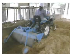
試験の様子(攪拌作業)

この技術による臭気発生低減効果を明らかにするとともに牛の行動等に及ぼす影響を観察し、有効性を検証します。(畜産研究部)