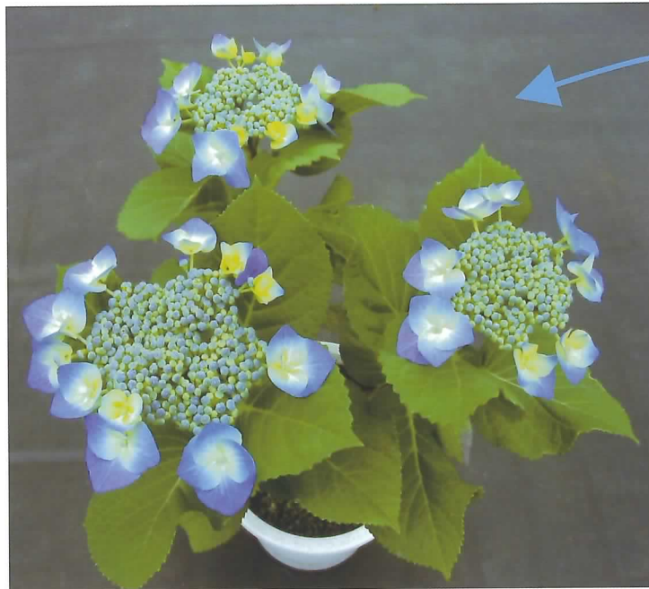
鮮明な青色が発色したハイドランジア