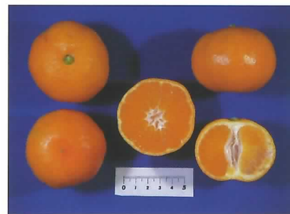
写真上：収穫期の果実 写真下左：「宮川早生」と「蒲郡1号（仮称）」の果皮色の比較 同 右：「蒲郡1号（仮称）」の果実