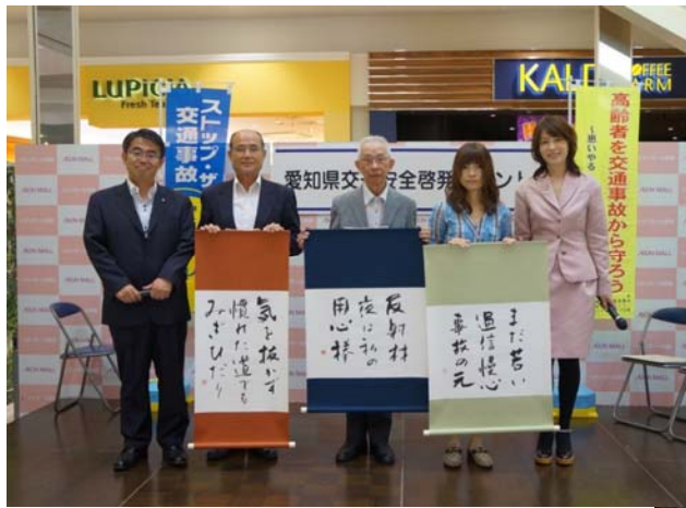
写真:平成26年9月の交通安全川柳