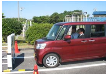
②衝突被害軽減ブレーキ(三河ダイハツ株)