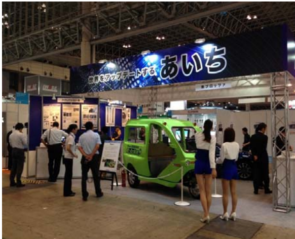
愛知県ブース写真