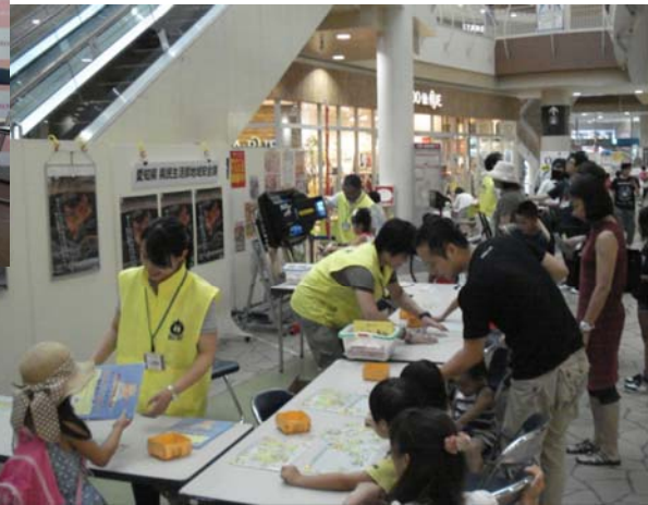
写真:平成26年8月のショッピングモールでの啓発キャンペーン