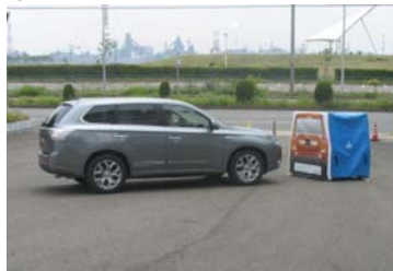
①衝突被害軽減ブレーキ(三菱自動車工業株)