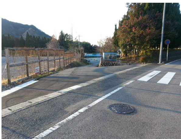
B 池野小学校敷地進入門