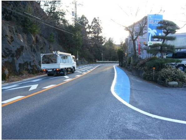
A 喫茶 ISLAND 下の道路