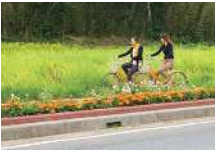
田原市和地町付近の風景