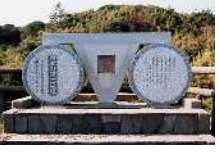
日本の道 100 選 朝顔 (渥美サイクリングロード)