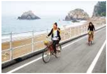
自転車場付近の風景