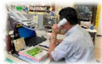
あいち人権センターの人権相談員

本県では、これまで人権課題に応じて様々な相談窓口を設置し、県民からの相談に対応してきました。しかし、人権課題は、内容が複雑多岐にわたり、また、明確に分野ごとに分けられない場合もあります。そのため、人権課題を抱える県民の相談に迅速かつ的確に対応できるよう、解決のための入り口として、人権に関する総合的な相談窓口を「あいち人権センター」内に設置し、関係機関と連携しながら、包括的・重層的に人権相談を行います。また、人権課題は、法的な問題も絡むことから、県弁護士会と連携して、弁護士による法律相談も行います。さらに、窓口で対応する人権相談員の資質向上を図るため、スキルアップ研修を実施することにより、人権に関する総合的な相談窓口をさらに充実させ、人権課題の解決に向けた支援をします。