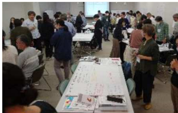
人権啓発キャラバンの様子

NPO等と連携し、県内4か所（名古屋市、岩倉市、刈谷市、豊橋市）で人権について考えるためのワークショップを開催し、延べ207名の参加がありました 9 。