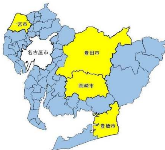
表 1 登録先と営業区域