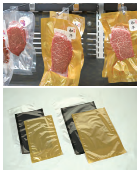
ノートレー包装のビーフパック。適度な酸素透過性を持たせることで、お肉の赤みを保ちつつ消費期限の延長を可能にした。

いてパッケージの面から真摯に向き合う姿が印象的でした。「先進的に食品ロス削減に取り組んでいる企業や団体の情報収集をしながら、商品の選択肢を増やしてみたいかがでしょうか。企業間のつながりを活かすことで、さらなるSDGs達成を目指すことが大切だと思います」と、これから食品ロス削減に取り組もうとする企業や消費者に向けてエールを送ってくれました。