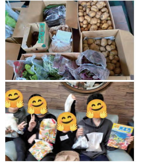
支援先の子ども食堂の様子。全国から集まった食材が子ども食堂を通してたくさん子どもたちに届けられている。