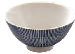
国民一人1日あたり、 約114gの食べ物を 捨てていることになります。

「食品ロス」とは、本来食べられるのに捨てられてしまう食品のこと。 日本全体で年間約523万トン(2021年度)、 愛知県では約48万トン(2019年度)発生しています。