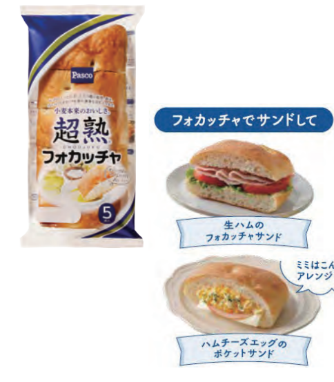
リニューアルの一例。耳も一緒に提供し、1袋あたり5gの食品ロス削減に成功。裏面には耳部分の活用方法が紹介されている。