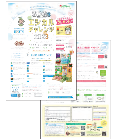
エシカルチャレンジのチラシ。参加者は食品ロス削減の工夫も記入でき、今までに1,000以上の声を集めた。