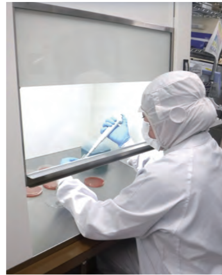
微生物の検査を行っている様子。このように検査を行うことで長時間、安心・安全に食べることのできる商品を製造している。