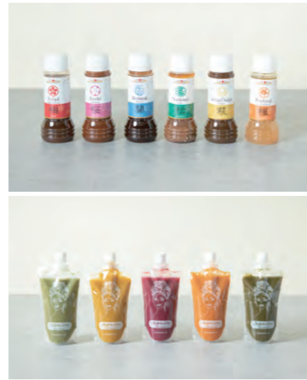
「世界中をおいしく、笑顔に。」をモットーに、規格外野菜・果物を使用したハラル食品(イスラム教の戒律によって食べることが許された食べ物)も製造している。