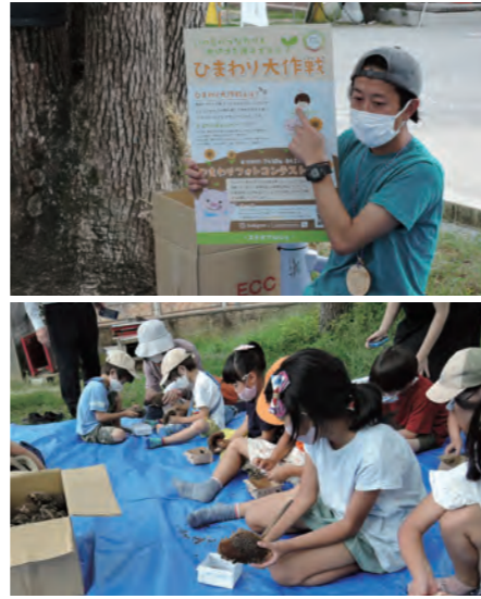
豊田市の花である「ひまわり」の種を餌にした、「ひまわりポーク」も生産している。小学生たちが育ててきたひまわりの種も使っている。