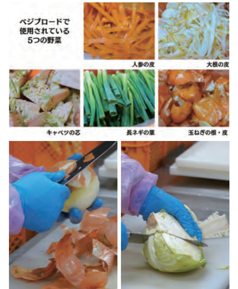
多くの栄養やうま味成分を含む野菜の皮や芯からとっただし(ベジブロード)。