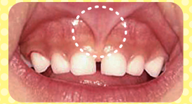
じょうしんしょうたい (上唇小帯といいます)

上の唇と前歯をつなぐスジはとても敏感です。ひっぱらない、指でガードする、たてにみがくなどの工夫がいらいます。