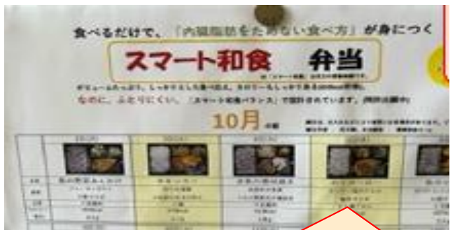
「スマート和食弁当」食べるだけで「内臓脂肪をためない食べ方」が身に付きます♪