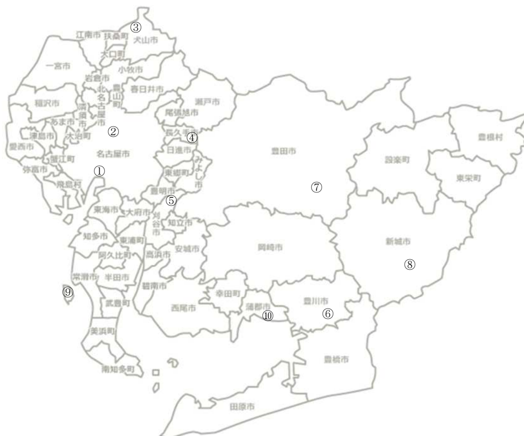
図-2 調査地分布図（数字は調査地ID-表-1参照-）