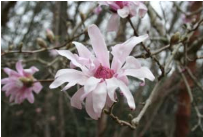
遊歩施設のシデコブシ(3月27日撮影)