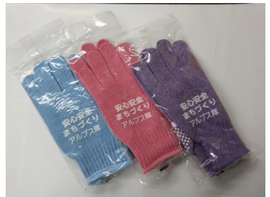
金融機関での啓発と啓発グッズ