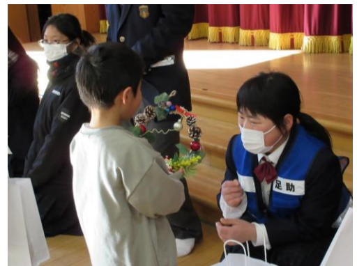
高齢者宅訪問と防犯リース作り・配布