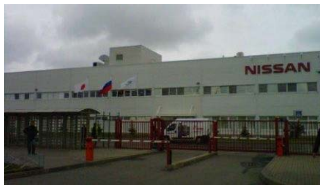
日産ロシア製造工場(NMGR)

で、今年は3車種、来年は9車種を生産する見込みなので、この時期の後にローカル化を続けていきたいとの話がありました。現時点での部品調達率はアフトワズ 83%、ルノー 60%、日産 30%だが、2016年にはそれぞれ80%、69%、65%が目標であり、どのようにアフトワズに近付けていくかがチャレンジングな課題とのことです。