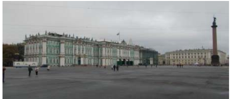
ロシア・サンクトペテルブルグの冬宮殿

パリ産業情報センターはこれまで、4月にロシア連邦のモスクワ及びサンクトペテルブルグを訪問し、当地において県内企業進出のフィージビリティスタディを目的とした調査を実施したほか、モスクワにおけるビジネス環境や、ロシア自動車産業の動向についてをレポートしたところです。