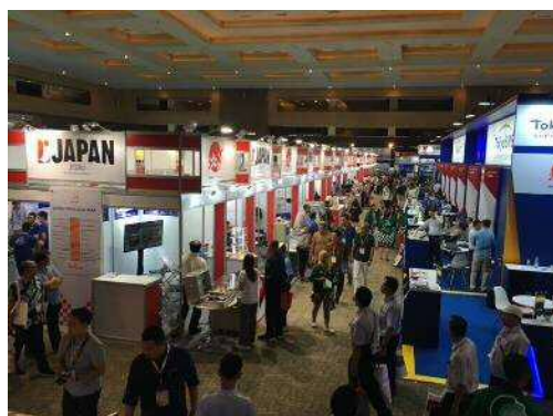
(ジャパンパビリオン)