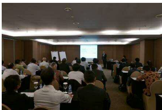
(ジャカルタ意見交換会)