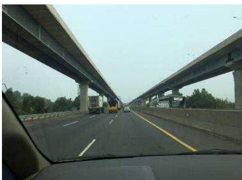
(完成間近の高速道路)