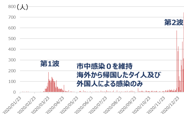
図1 タイの新型コロナウイルス新規感染者数の推移

“【速報】首都西郊で500人超感染、夜間の外出禁止”12月19日(土)の深夜、スマホに届いた報道機関の速報で目が覚めました。報じられた内容は、「タイ保健省が、首都バンコク西郊サムットサコン県で新型コロナウイルスの感染者が新たに500人以上確認されたと発表した。同県には22時から翌朝5時までの夜間外出禁止令が発令された。」というものでした。多数の感染者を把握すると同時に県ごとロックダウンをするタイ政府の初動の早さは2020年3月の行動制限の導入と同様のものでした。