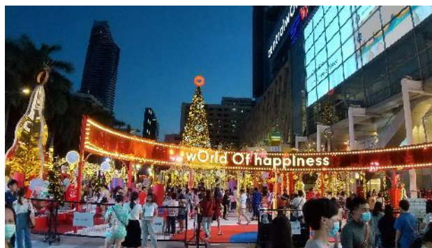
図5 クリスマスイルミネーションに賑わう人々

対応を受け止めることができています。日々の感染状況を踏まえて、国と地方が分担して矢継ぎ早に制限をかけていく手続きは、強権的な面や、スピード感に行政の現場や社会がついていけず混乱が生じることもありますが、個々の判断は適格な印象で、頼もしさも感じています。また、現時点ではバンコク都内のショッピングモールは営業が認められていたり、店内飲食制限の時間を調整されたりするなど、経済活動と感染対策の両立を図る姿勢も垣間見えます。