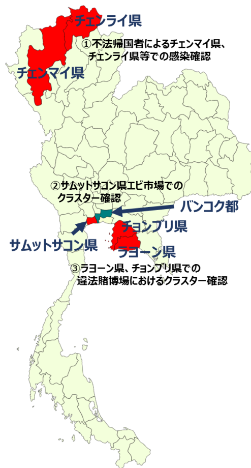
図 2 最近のタイにおける新型コロナクラスター

広がった感染者数は、バンコク都 245 人を含む 56 都県、4,519 人にまで拡大しました。これは、2020 年 1 月から 11 月までの累積感染者数 3,998 人を僅か 1 か月弱で上回る、タイにとって急速な感染拡大です。