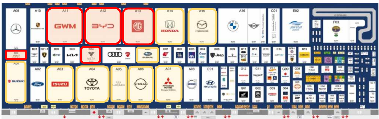
図1 Thailand International Motor Expo 2022 会場レイアウト 出所：主催者ホームページ。日系メーカーを黄色、中国系メーカーを赤色で表示。

モーターエキスポには、会期中に一般来場者：1,335,573名、オンライン参加者：141,442名、合計150万名弱の参加がありました。当センターは開場初日に現場を視察しました。平日にも関わらず多くの参加者が来場し、日系メーカーはもちろんのこと、欧州メーカー、開催前から注目を集めていたBYD、GWM、MGといった中国系メーカーにも人が押し寄せ、活発に予約商談が進む様子を目にしました。これら大手メーカー以外にも、新たな中国系メーカーとして、11月末にタイ政府物品税局とEV利用促進政策の覚書を締結した