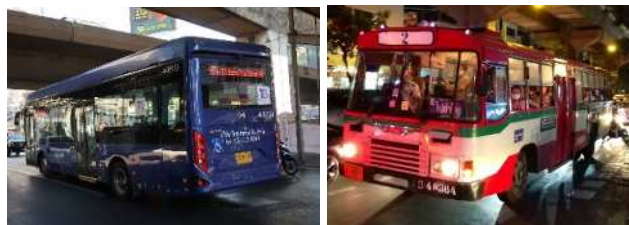
図4 バンコク都内を走るバス 左：最近見かけることの多くなった電動バス。EV のためマフラーは無く、排気ガスは出ない。右：従来型のディーゼルバス。エアコンが付いていないバスは乗車価格が安価。

して愛されてきた MITSUBISHI、ISUZU、HINO といった日本企業のロゴが付いたクラシックなバスは、古き良きアジアの熱気を生む象徴として日本から当地を訪れる人に好意的に捉えられる一面もあったような気がします。変わり続ける町の風景からも EV 化の動きを感じるとともに、今しか見ることのできない景色を記憶にとどめたいと思う今日この頃です。