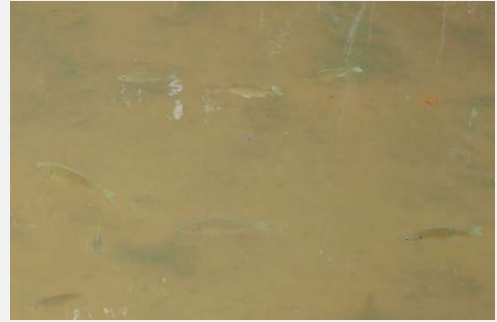
水面近くを泳ぐブルーギルの群れ