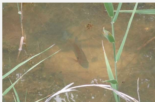
産卵床を守るオス