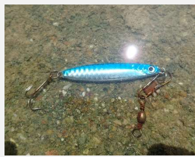
放置されたルアー