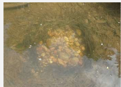
ブルーギルの産卵床