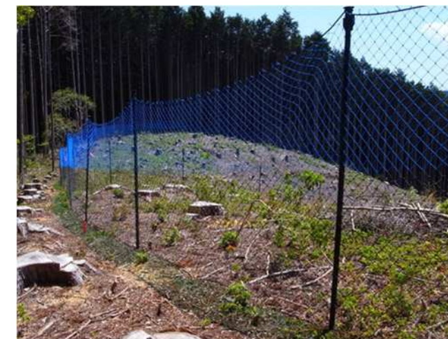
獣害防止柵設置状況