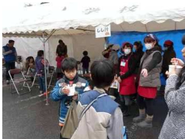
写真2 地区の交流会でシシ汁が振る舞われる様子