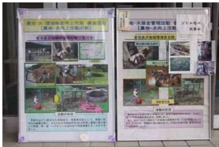
写真3 パネルによる駆除組合の活動のPR