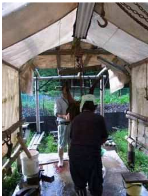
写真1 自前の解体施設で楽に解体

また、獣害対策への意識があまり高くない農家や新興住宅地の住民に対して、組合活動をパネルにし交流会等でPRを行うことで、理解を得られるとともに良好な関係を築いている（写真3）。