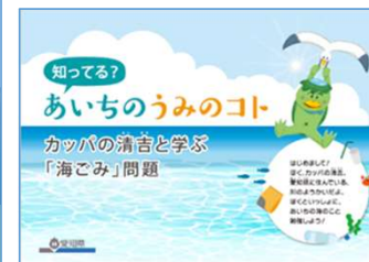
愛知県 環境学習プログラム