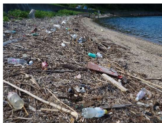
海岸に漂着したプラスチックごみ