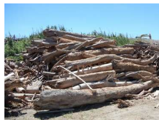
大雨後に港に積み上げられた流木

流域圏での海洋ごみ対策の推進により、伊勢湾の良好な景観や海洋環境の保全を図ることを目的に、岐阜県・愛知県・三重県が共同で本計画を策定