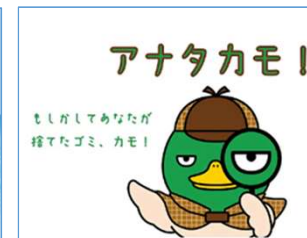
三重県 普及啓発動画