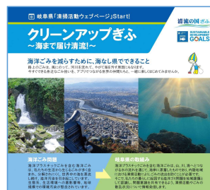
岐阜県 清掃活動ウェブページ