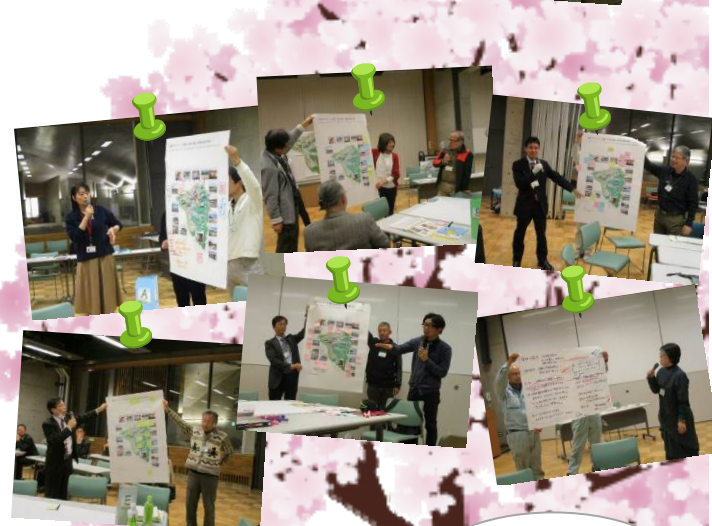
グループワークの発表の様子