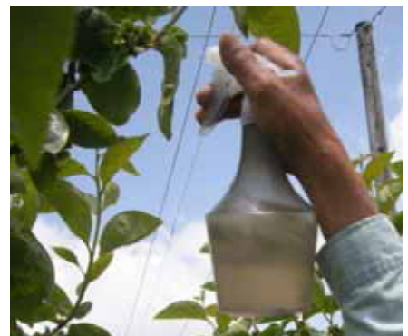
写真1 ジベレリン処理方法

摘蕾は満開期の5月21日に行った。通常摘蕾区は結果枝の長さが40cm以上では1枝4蕾、30cm程度では1枝3蕾、20cm以下では1枝2蕾になるように摘蕾した。弱摘蕾区は遅れ花のみを除去した。なお、摘蕾を行わない無摘蕾区を設けた。満開10日後の6月2日に200ppmのジベレリンをハンドスプレーで結果枝中央の大きな蕾に噴射した（写真1）。調査は5月21日から9月4日までの間、着果数と果実横径を調査した。