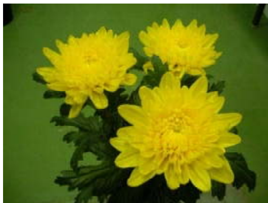
写真1 開花時の様子

「愛知夏黄1号」は、愛知県が愛知県花き温室園芸組合連合会きく部会と共同育成した夏秋系黄色一輪ギクである。平成15年に農業総合試験場が行った交配に始まり、以降試験栽培を繰り返し、平成21年3月に品種登録出願、同年5月には登録申請公表がされ、現在6～8月開花作型で本格的な生産がスタートしている。市場評価は高く、夏系黄色一輪ギクの主要品種としてのさらなる普及が期待されている(写真1)。