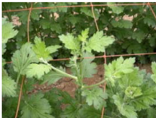
写真2 ヤナギ芽の発生

「愛知夏黄1号」は長日処理中でも花芽分化しやすい。その場合は花首が必要以上に長くなり、上位葉には柳葉が目立ついわゆるヤナギ芽となり、著しく品質が落ちる（写真2）。このようなヤナギ芽発生防止こそがこの品種を高品質安定生産する最大のポイントである。そのためには以下の点に留意して生産する必要がある。