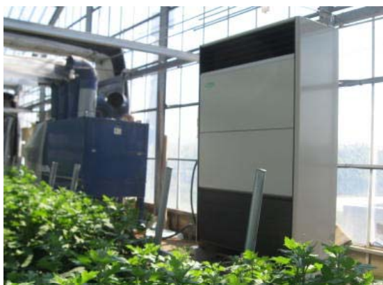
写真1 ヒートポンプ室内機の設置状況

ヒートポンプの導入経費は、設置及び電気工事費を含め237万円（うち自己負担額は133万円）であった。また、電気の契約容量が4kWから15kWに変更され、年間の基本料金が13.4万円増加した。