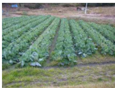
写真3 キャベツの栽培状況