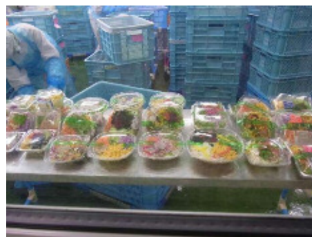
写真1 自社工場で加工したカット野菜

皆で行うことが必要」という考えのもと、生産者とクレーム等を情報共有し、産地から実需者まで密な連携を図っている。これにより、加工・業務用野菜の品質に対する生産者の意識が向上している。また、自社で集荷から加工まで行うことで、栽培から商品までの一貫した品質管理が可能となり、食品の安全・安心を守りつつ、決まった時期（定時）に決まった量（定量）を同じ品質（定品質）、同じ価格（定価格）で出荷することを実現している。