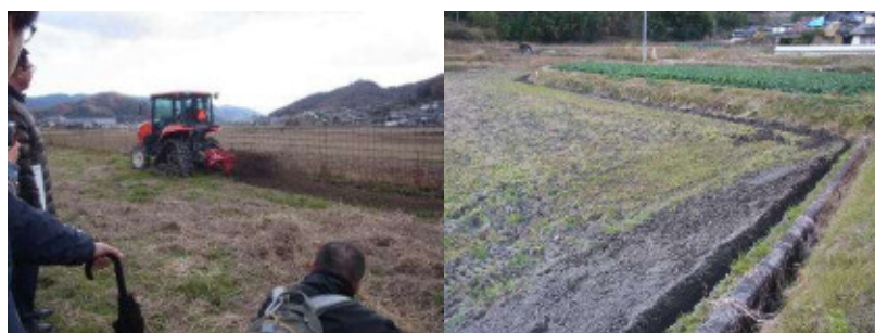
写真2 水田での額縁明渠設置の様子

水田における露地野菜の安定生産に向けて、高畝（高さ25～30cm、2条／畝）や額縁明渠（深さ25cm程度）などによる排水対策に力を入れている（写真2）。キャベツの10aあたりの収量は約6tと、水田での収量としては多い（写真3）。今後の目標は、栽培面積を増やしつつ、単収を更に向上させることである。