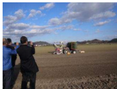
写真4 集約して3ha／筆になったほ場

ほ場は、県西南部にある笹岡湾干拓地にある。ほ場1筆の面積が50aと大きく、集約して1ha以上のほ場にするすることで、機械作業が効率よくできるように整備している（写真4）。