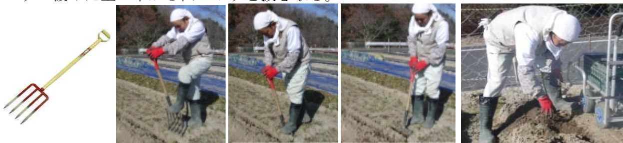
写真5 フォークを使った山ゴボウの収穫方法（周囲の土を緩めた後に抜き取る）