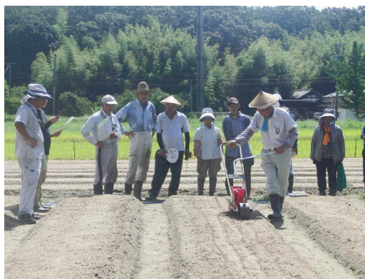
写真3 は種機の使い方