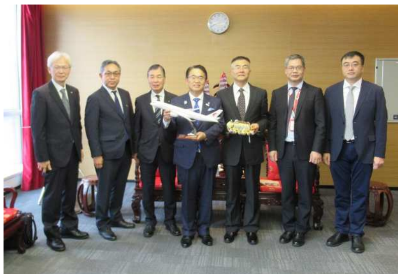
参加者の集合写真