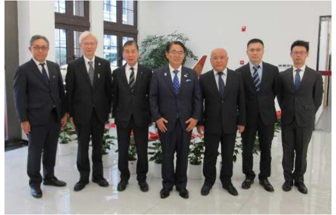
参加者の集合写真