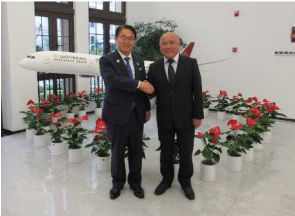
于総裁との記念写真