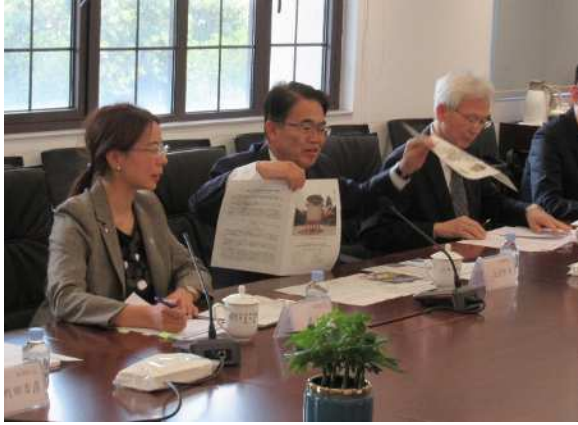
上海吉祥航空との面談の様子