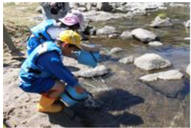
アユの体験放流の様子（豊田市）