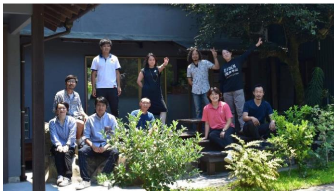
アントレワーク実践者