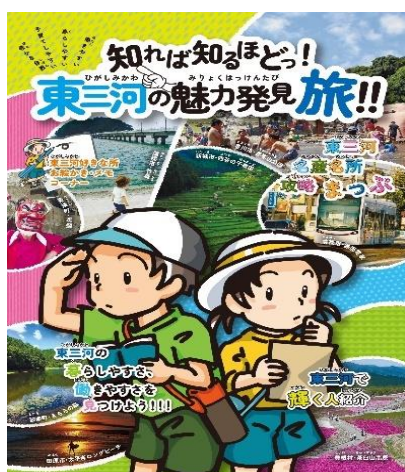
知れば知るほどっ！東三河の魅力発見旅！！（表紙）