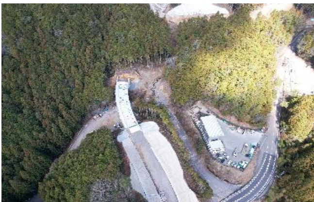
国道 257 号（設楽町）