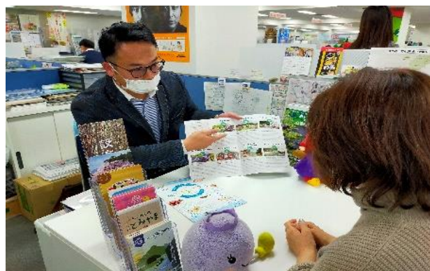
愛に行こう！あいち移住・定住相談センター （東京都有楽町）