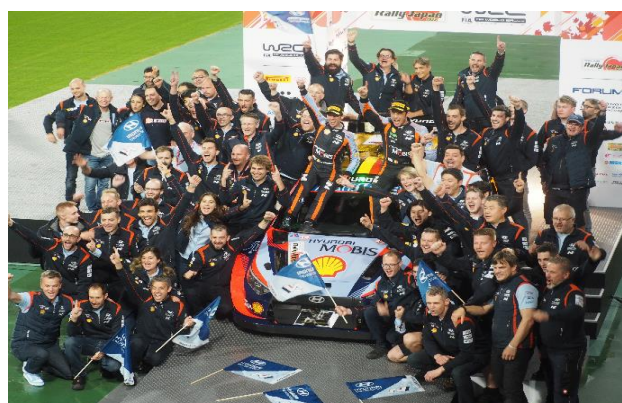
F I A世界ラリー選手権（WRC）ラリージャパン 優勝チームの集合写真