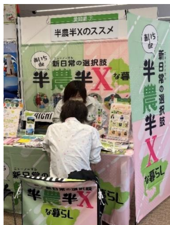
就農移住相談会の様子