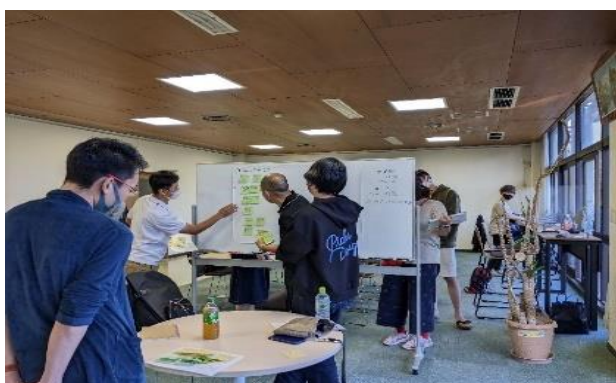
ワーケーション実証ツアー グループワークの様子