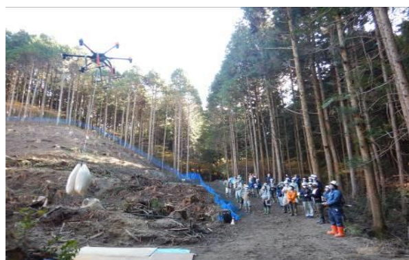
ドローンによる苗木運搬（豊田市）