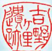
吉野ヶ里歴史公園