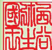
出雲弥生の森博物館