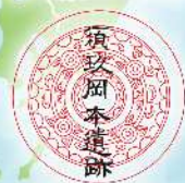
奴国の丘歴史資料館