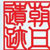
あいち朝日遺跡ミュージアム