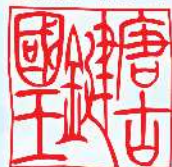
唐古・鍵考古学ミュージアム