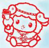
市立池上曾根弥生学習館