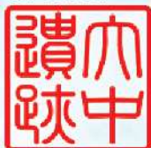
兵庫県立考古博物館 播磨町郷土資料館