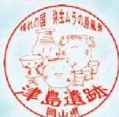
遺跡&スポーツミュージアム