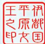
伊都国歴史博物館

お手持ちのメモ帳・ノート・御朱印帳などに押印します。 考古学者御用達、野帳(測量野帳)にも押印できます。