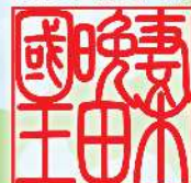
むさびんだ史跡公園