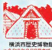
横浜市歴史博物館 ※令和6年2月2日まで 遺跡公園内工房にて押印

大小の集落・祭祀場・港湾・様々な形の墓・水田等... 地域色豊かな弥生時代を体感できる全国26遺跡