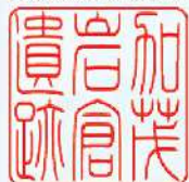
加茂岩倉遺跡ガイドス