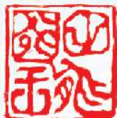
尼崎市立歴史博物館田能資料館