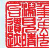
名古屋見晴台考古資料館