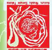
朝倉市平塚川添遺跡公園