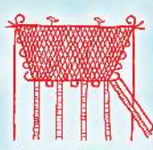
池上曾根弥生情報館