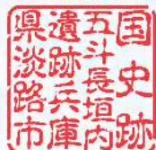
五斗長垣内遺跡活用拠点施設