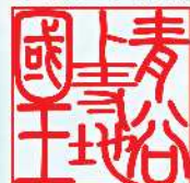
鳥取市青谷上寺地遺跡展示館 ▲R5.11.23まで ▼R6.3から 青谷かみじち史跡公園