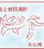
大阪府立弥生文化博物館