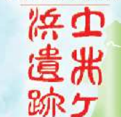
土井ヶ浜遺跡・人類学ミュージアム