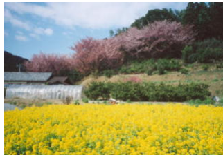
桜・桃・菜の花が早春の集落を彩る