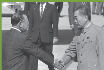
田中角荣首相与周恩来总理