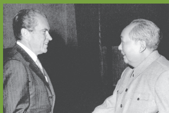
尼克松总统与毛泽东主席