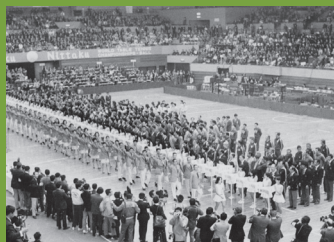
第三十一届世界乒乓球锦标赛开幕式