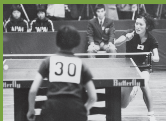
女子团体决赛 日本队与中国队