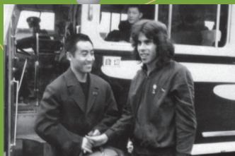
庄则栋选手与格伦·科恩选手