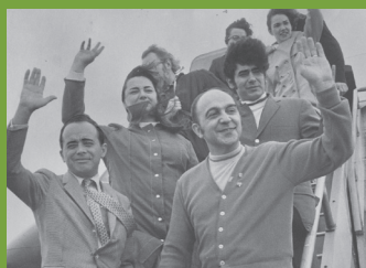
美国队由日本东京羽田机场飞往中国