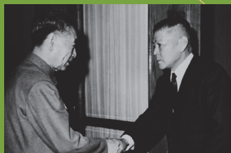
日本乒乓球协会后藤钾二会长为邀请中国队参赛访问北京时,与周恩来总理握手。