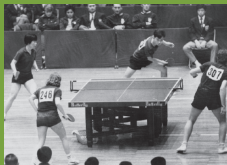
混合双打决赛 中国获冠军