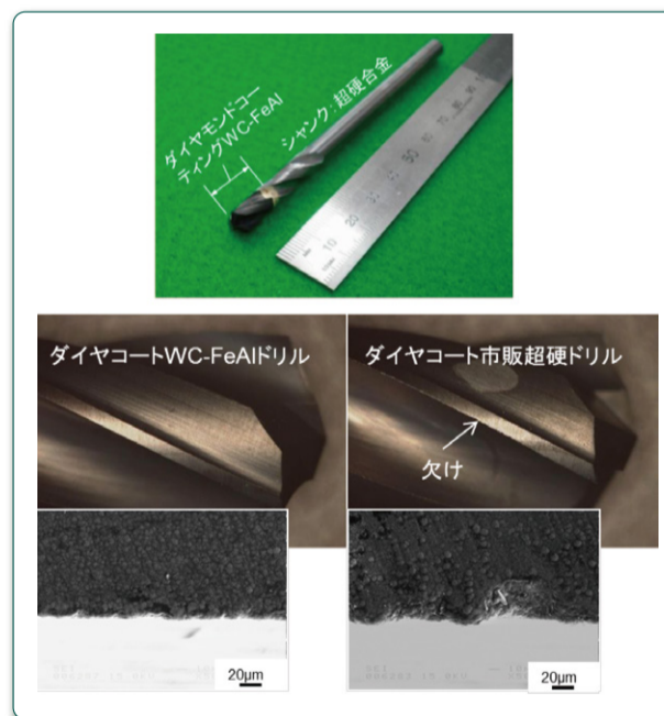
図2 試作したWC-FaAlドリルと工具刃先の観察