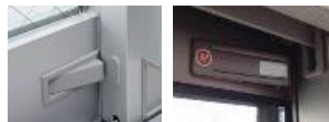
住宅等の防犯部品