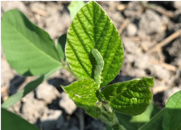
図4 ダイズに寄生するシロイチモジヨトウ