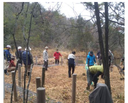
湿地保全活動の様子

今後も保全作業を実施し、植物分野の専門家の指導・助言のもとに湿地の保全に努めていく。