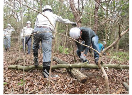
シデコブシ保全活動の様子

今後も保全作業を実施し、名古屋大学の指導・助言のもとにシデコブシの保全に努めていく。