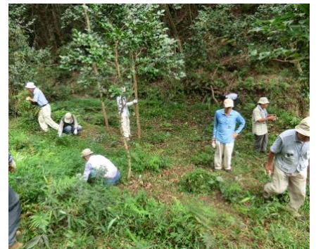
スミレサイシン保全活動の様子

今後も保全作業を実施し、植物分野の専門家の指導・助言のもとにスミレサイシンの保全に努めていく。