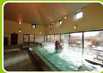
住所/東栄町下田字花田21

湯量が豊富で源泉かけ流しの露天風呂もある天然温泉。温泉のほか、館内には食事やお土産の購入ができる施設も揃っていて湯上りのひと時を楽しめる。