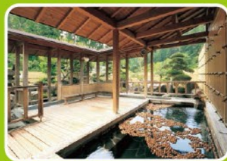
住所/豊根村黒川字長野田20

美肌になると評判のとろっとした泉質が人気の天然温泉施設。大浴場をはじめ8種の温泉が楽しみ、山里の風景を眺めながらの露天風呂は格別。