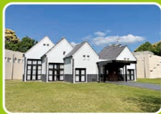
住所/新城市竹広字信玄原552

大河で話題の、長篠・設楽原の戦いにつながる貴重な資料を展示・解説している資料館。特に火縄銃、古式銃の展示では、質・量とも日本一の規模を誇る。