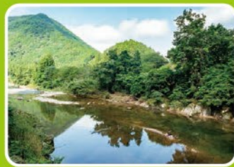
住所/東栄町下田中原3

小さな子どもでも安心して川遊びができるエリアを開放。キッチンカーなどの出店やキャンプサイトの提供など、7/29(土)~8/27(日)までの期間限定で実施するレジャーイベント。