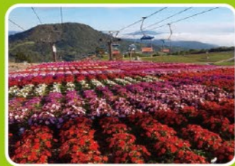
住所/豊根村坂宇場字御所平70-185

マウンテンバイクやゴーカート、池でのボートなどアウトドアを目一杯楽しめる。高原にあるドッグランも人気で、夏はキャンプにも最適!