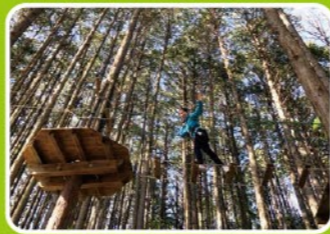
住所/新城市浅谷字ヒヨイタ40

急斜面に遊具を配置した「城攻め」をテーマにした巨大な遊び場「わんぱく広場」や、自然の森を活かしたアウトドアパーク「フォレストアドベンチャー・新城」が楽しめる。