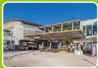
住所/設楽町清崎字中田17番地7

設楽町の食材を使ったメニューを味わえる食堂や、地元の特産品が並ぶお土産コーナーが人気。その他、日本酒づくり体験ができる施設や地域の歴史・文化が学べる奥三河郷土館も併設。