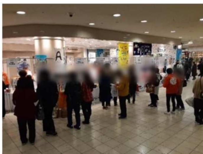
前回実績風景：デイズスクエアでの開催の様子（2022年）