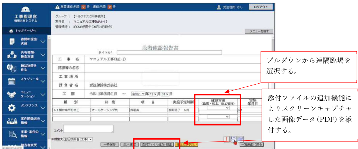
図-2 情報共有システムへの入力方法（段階確認の例）