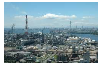
四日市コンビナート