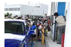
水素ステーション 見学会の様子