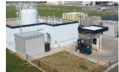
認証プロジェクト例 セントレア貨物地区 水素充填所

○ 中部圏内で製造された低炭素水素を利活用するプロジェクトの認証(低炭素水素認証制度)