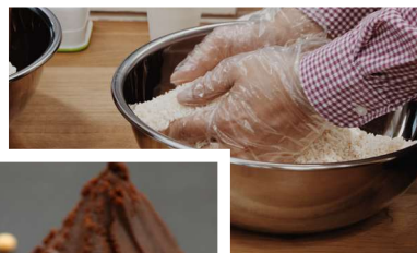
된장 만들기를, 체험할 수 있다!!