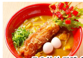
도요하시 카레 우동

도요하시시 히가시나나네초 이치노사와 113-2 아이치현 최대급의 미치노 에키(도로 휴게소)입니다. 특산품을 기념물로 사거나 토요하시 카레 우동 등 지역의 식사를 즐길 수 있습니다.