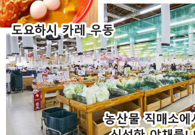
농산물 직매소에서 신선한 야채를!!