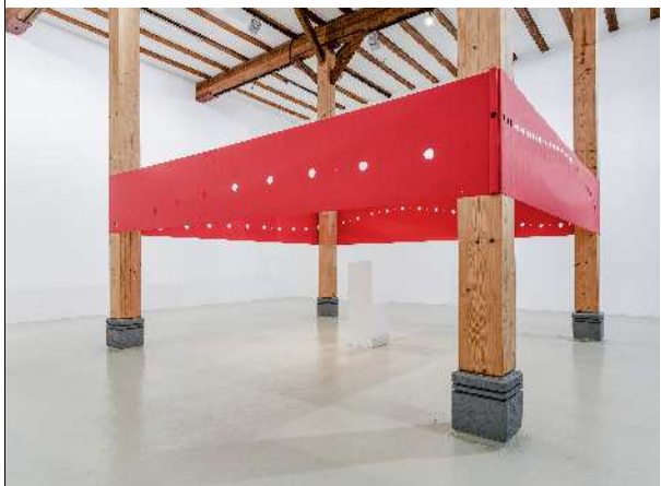
「One is Many Many is One」(令和4年) ギャラリー・ホフマン (ドイツ)