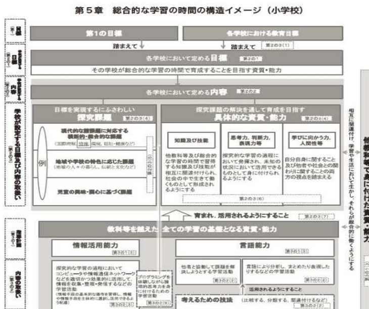
(「小学校学習指導要領解説 総合的な学習の時間編」平成29年7月 文部科学省)

右の図のように、各学校は、学習指導要領における「第1の目標」と「各学校の学校教育目標」を踏まえ、各学校の総合的な学習の時間の目標を定める。そして、各学校において設定する内容に、「目標を実現するにふさわしい探究課題」及び「探究課題の解決を通して育成を目指す具体的な資質・能力」を設定する。その際には、「知識及び技能」「思考力、判断力、表現力等」「学びに向かう力、人間性等」の三つの柱を設定する。さらに、教科等の枠を越えた全ての学習の基盤となる資質・能力が育まれ、活用されるものとなるよう配慮する。