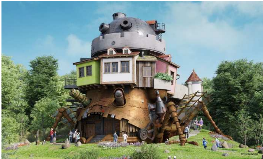
[ ハウルの城 ]