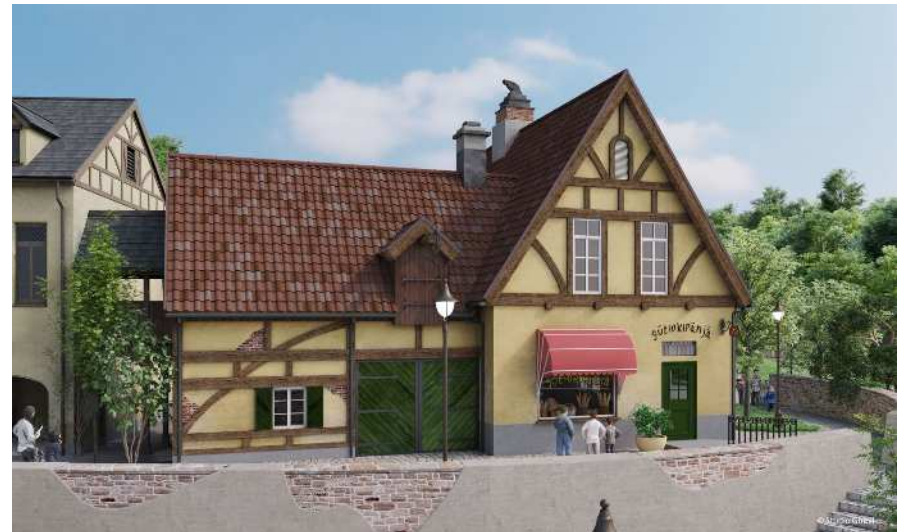
[ グーチョキパン屋 ]