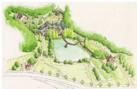
[ 鳥瞰図 ]