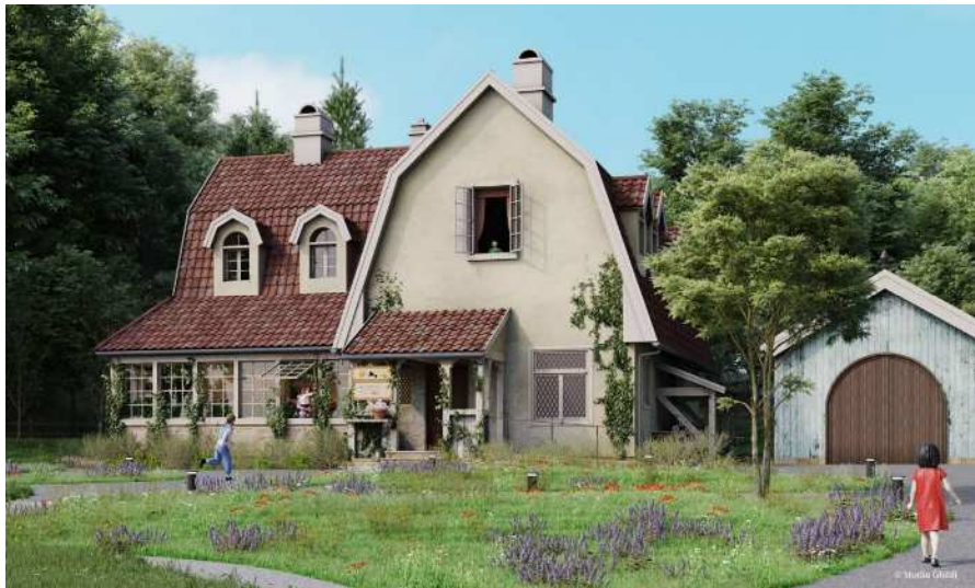
[ オキノ邸 ]