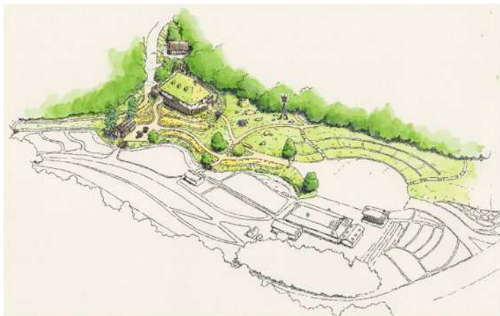
[ 鳥瞰図 ]

映画『もののけ姫』のエミシの村とタタラ場をもとにした和風の里山的風景をイメージしています。