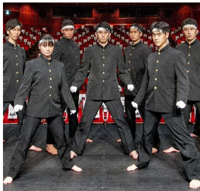
<青春応援団 我無沙羅の皆様>

2018年には、フランス・パリで行われた「JAPAN EXPO」に出演し、パフォーマンスを披露するなど、世界にも認められる活躍をしています。