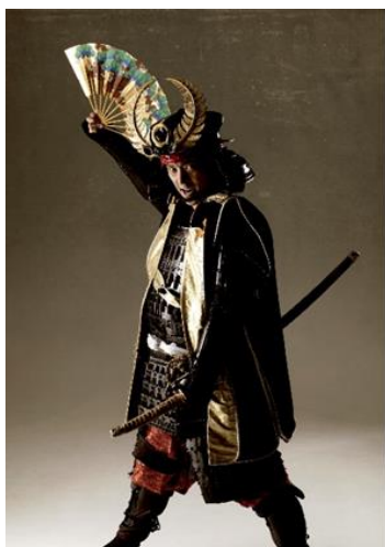
とくがわいえやす 徳川家康

徳川家康と服部半蔵忍者隊®の出演者 [2月3日(金)アスナル金山 明日なる!広場]