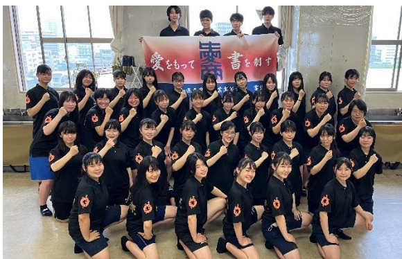
<県立愛知商業高等学校書道部の皆様>