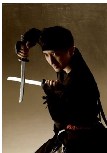
ゆうなぎ ぜん 夕風の善