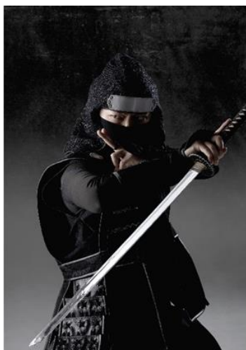
はっとりはんぞう 服部半蔵