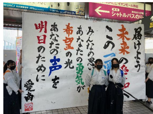
<書道パフォーマンス風景>