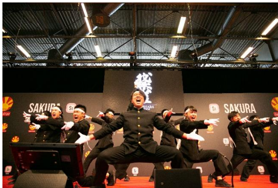
<応援パフォーマンス風景>