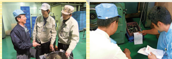
改善指導ノウハウが豊富なシニア指導員が、月2回の定期訪問。