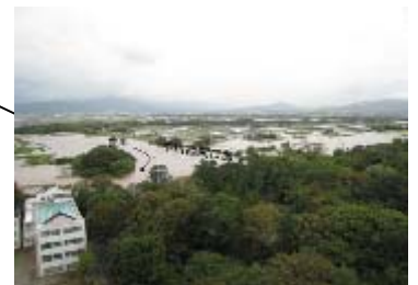
豊川の浸水状況 (豊橋市) 【平成23年9月台風15号時】