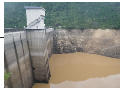
宇連ダムの濁水状況 (新城市) 【平成25年9月 貯水率0.8%】