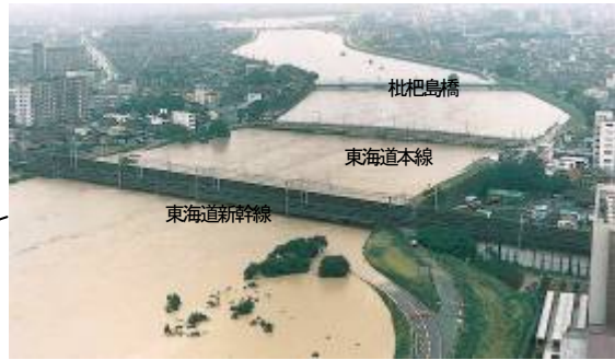
JR東海道新幹線庄内川橋りょう付近 【平成12年東海豪雨時】(名古屋市西区・清須市)