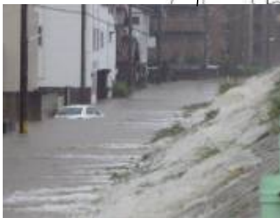
八田川の浸水状況 (春日井市) 【平成23年9月台風15号時】