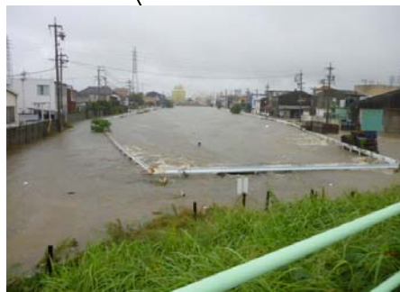
地藏川の浸水状況 (春日井市) 【平成23年9月台風15号時】