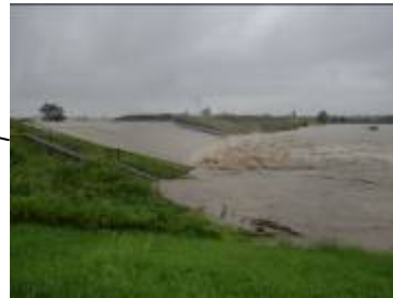
激特事後初めて越水する洗堰 (名古屋市北区) 【平成23年9月台風15号時】