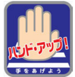
ハンド・アップ運動のシンボルマーク