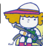
愛知県交通安全 マスコットキャラクター シーベルちゃんと まもるくん

県内一斉シートベルト・チャイルドシート関所 2月17日（金） 「カチッと100！」シートベルト・チャイルドシート着用徹底強化旬間 〔 2月11日（土）～ 2月20日（月） 6月11日（日）～ 6月20日（火） 11月11日（土）～ 11月20日（月） 〕