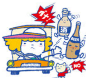
愛知県交通安全 マスコットキャラクター シーベルちゃん