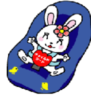
チャイルドシート着用 推進シンボルマーク 「カチャピョン」